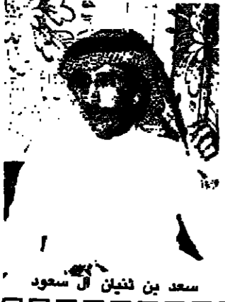
سعد بن ثنيان آل سعود

●● عن الإنجاز الذي حققه المراد منتخبنا للناشئين وحصولهم على بطولة كأس العالم تحدث ، لعكاظ ، الأمير سعد بن ثنيان آل سعود الذي قال انه من خدام الحرمين الشريفين وولي عهده الأمين والأمير الشاب وكل من سلمهم في انتصاري منتخبنا الغالي